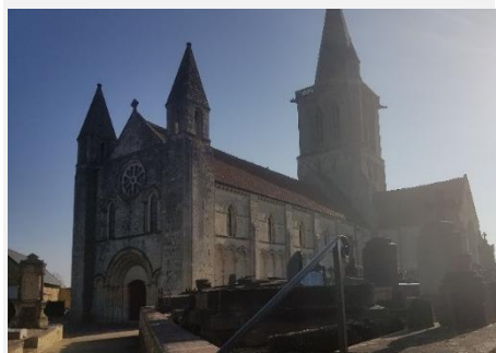
Eglise Saint Ouen de Rots

L'Église paroissiale Saint-Ouen de Rots appartenait, au moins depuis l'époque carolingienne à l'Abbaye St-Ouen de Rouen, ce qui explique sans doute ses dimensions exceptionnelles (40m de long). La nef datant du XII e s se signale par l'ampleur de son décor d'arcatures aveugles. Le 1 er étage de la tour est du XIII e s, le second du XIV e et le 3 e du XV e s. Cette église possède de beaux bas-reliefs à titre d'exemple : un évêque bénissant, qui est peut-être St Ouen, et un autre personnage énigmatique tenant un marteau et dissimulant un enfant sous sa cape.